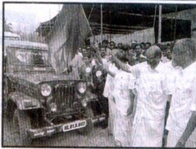
எக்ஸோ டிரீலத்துக்கு டொடி அடிப்பு...